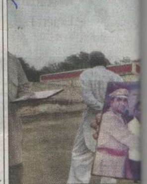
A family member of slain DSP at his ancestral house in Saran