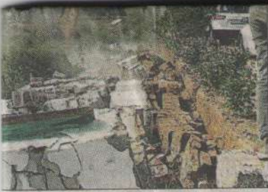
ने काटी गई कॉलोनी को ध्वस्त करते कर्मचारी। संवाद