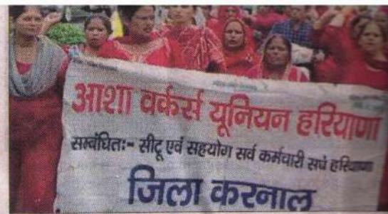
Asha workers take out a march in Karnal.

He said as per the report of the samples, neem oil was found in the report of the samples, which proved that the bags contained agriculture-grade urea.