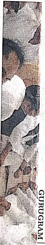
Congress leaders stage a sit-in in Chandigarh on Tuesday.