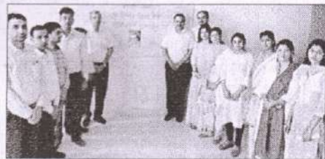
रोहतक में शुक्रवार को बाबा मस्तनाथ विवि में आयोजित विचार संगोष्ठी में मौजूद मुख्य वक्ता।