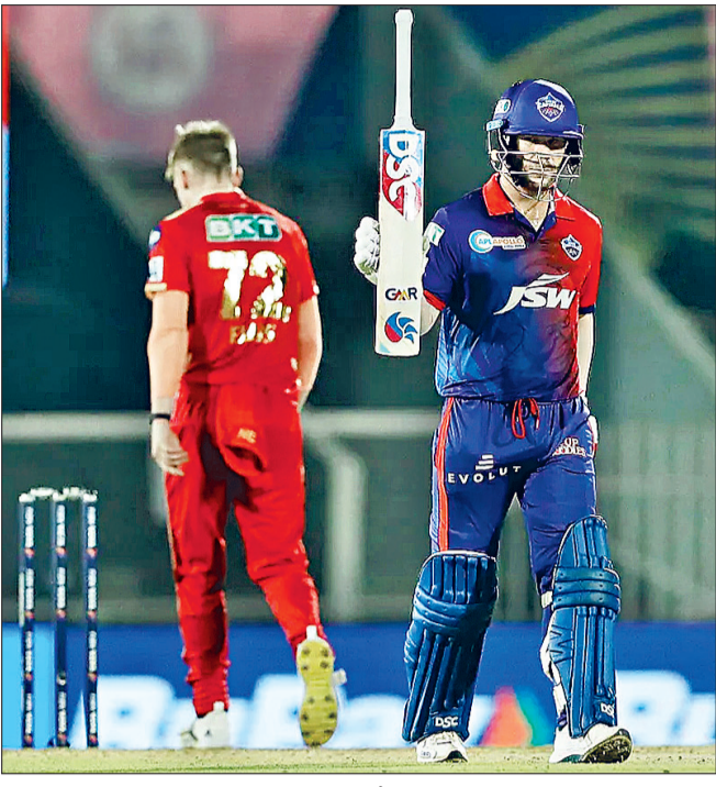
पहुंचा दिया जिसकी यह छह मुकाबलों में कैपिटल्स के नेट रन रेट में अच्छी तीसरी जीत थी। इस जीत से दिल्ली बढ़ती हुई। टीम ने एकमात्र विकेट

■ पंजाब किंग्स को महज 115 रन के स्कोर पर ही समेटा