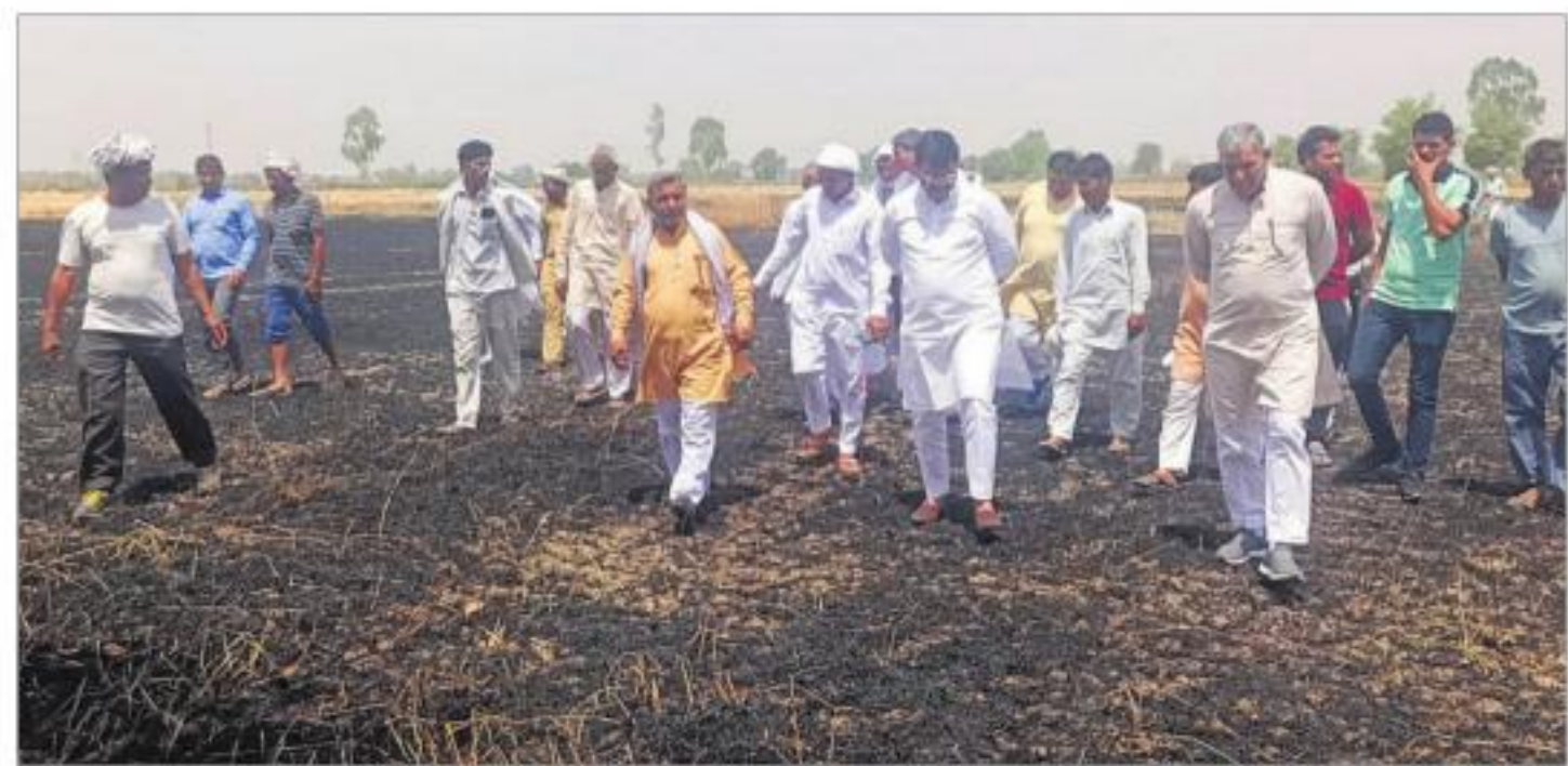
Farmers show their wheat crop destroyed by fire to the MLA in the Meham constituency of Rohtak.