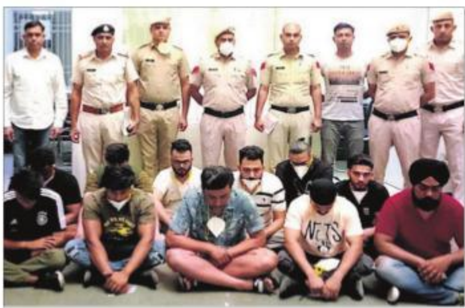
The accused in police custody in Gurugram.

GURUGRAM, APRIL 20 The Gurugram cybercrime police busted yet another fake call centre being run from a rented house in South City 1, Sector 51, and arrested 14 persons, including three women and four partners, here today. The police have also recovered 14 laptops, nine cell-phones and Rs 1,13,930 cash from the employees. This fake call centre, operational since March 1, has five partners. Posing as Microsoft employees, they were duping foreigners through pop-ups offering technical support, hardware upgrade and antivirus etc. Inspector Samer Singh of the cybercrime police station got a tip-off, following which