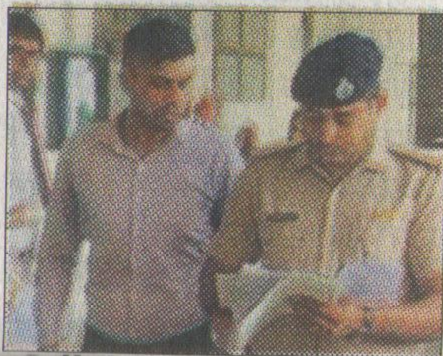
बहादुरगढ़, 19 मई