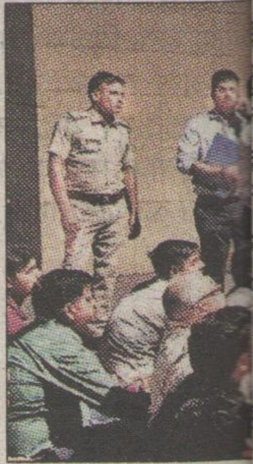
सीजीएसटी कार्यालय के सामने प्रदर्शन

प्रदर्शन को देखते हुए सोहना थाने से पुलिस के साथ एसीपी सदर अमन