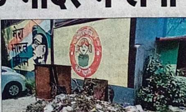
स्कूल के बाहर जमा कूड़े का अंबार

■ स्कूलों में स्थानीय लोगों के विरोध पर मौन है जिला शिक्षा अधिकारी