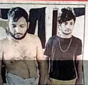
मांस गांव में गोशिकी कर गौ मांस बेचने के मुख्य आरोपी पुलिस की गिरफ्तार में

■ दोनों आरोपियों के खिलाफ विभिन्न धाराओं के तहत मुकदमा दर्ज