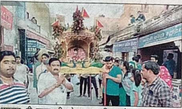
भगवान श्री कृष्ण की शोभा यात्रा निकालते सनातन धर्म समाज समिति के सदस्य

■ पालकी में बैठे ठकुर जी महाराज के भव्य श्रृंगार ने लोगों का मनमोह लिया