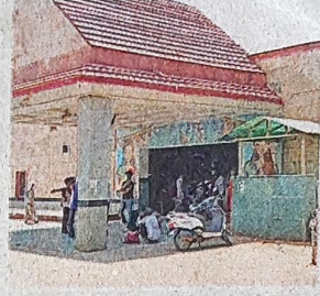
गुडगांव रेलवे स्टेशन

जागरण संवाददाता, गुरुग्राम: गुडगांव रेलवे स्टेशन का नाम बदलने के लिए रेलवे को कितना समय चाहिए, यह सवाल हर क्षेत्र के लोग उठाने लगे हैं। लोगों का मानना है कि जब जिले का ही नाम बदल दिया गया, फिर रेलवे स्टेशन का नाम नहीं बदलने का क्या औचित्य है? होना तो यह चाहिए था कि जिले के नाम के साथ-साथ स्टेशन का भी नाम बदल दिया जाना चाहिए था। यदि उस समय ऐसा नहीं हो सका तो कुछ दिन बाद इसे बदल देना चाहिए था। छह साल बाद भी नाम नहीं बदलना, ठीक समझ से परे है।