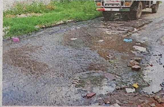
आइएमटी सेक्टर आठ की सड़क पर बहता सीवर का पानी

औद्योगिक क्षेत्र के सेक्टर सात और आठ, गांव अलियर, ढाणा, बास कुशला के लोगों को रोजाना इस समस्या का सामना करना पड़ रहा है। सेक्टर आठ में कार्य करने वाले श्रमिकों को भी गंदे पानी से होकर गुजरना पड़ता है। गांव अलियर में तो