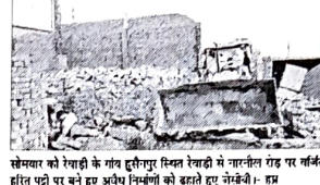
सेक्टर में रेवाड़ी के गांव टुकीपुर स्थित रेवाड़ी में गांवपाली रोड पर नई डीटीपी पट्टी पर बने हुए अवैध निर्माणों को ढहाते हुए नगरपाली...