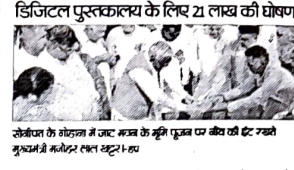
जे.सी.बी. 17 जुलाई (भा.) मुख्यमंत्री ने गोहाना में जाट भवन की नींव रखी...