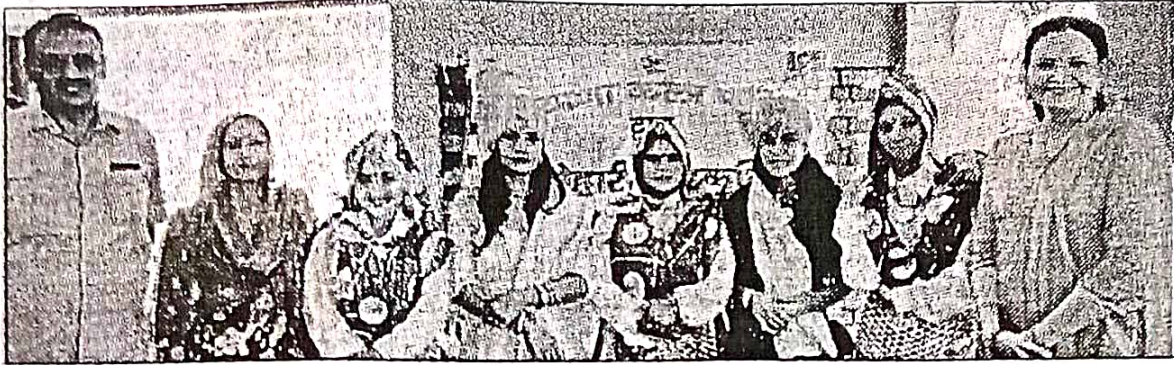
सिलानी में हरियाणवी संस्कृति पर प्रस्तुति हरियाणा कला परिषद के कलाकार।