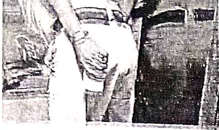
च करते पुलिसकर्मी। • विज्ञापित