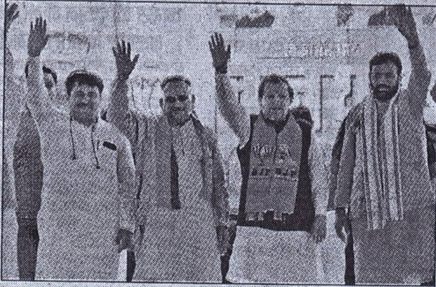
बहादुरगढ़। जनता का अभिवादन स्वीकार करते मुख्यमंत्री व अन्य नेता।

मुख्यमंत्री नायब सैनी व्यापारियों को मिल रही धमकियों पर कड़ा संज्ञान लेते हुए चेतावनी दी है कि या तो दबंगई-दबंगई छोड़ दें या फिर कड़े परिणाम भुगतान के लिए तैयार रहें। पुलिस किसी भी सुरत में किसी भी दबंगई को नहीं बखोरीगी। उन्होंने व्यापारियों को आश्वासन दिया कि व्यापारियों की सुरक्षा में किसी प्रकार की कोई कोताही नहीं बरती जाएगी। सीएम सैनी रविवार को रोहतक लोकसभा क्षेत्र से भाजपा उम्मीदवार डॉक्टर अरविंद शर्मा के समर्थन में बहादुरगढ़ में आयोजित विजय संकल्प रैली को संबोधित कर रहे थे। हरियाणा के मुख्यमंत्री नायब सैनी ने कार्यकर्ताओं से प्रदेश की सभी लोकसभा सीटों व करनाल विधानसभा