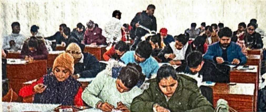
भारत्तर न्यूज़ | रोहतक

हैप्पीनेस को जीवन के कण-कण में समाहित करने, खुशी की मुहिम को यूनिवर्सिटी मुहिम बनाने और विश्वविद्यालय में खुशनुमा माहौल सृजित करने के उद्देश्य से शुक्रवार को महर्षि दयानंद विश्वविद्यालय के हैप्पीट्यूड लेबोरेट्री के तत्वावधान में डा ए हैप्पी पर्सन गेम का आयोजन किया गया। विश्वविद्यालय के फैकल्टी डेवलपमेंट सेंटर में इस अनूठे कार्यक्रम में विश्वविद्यालय के विद्यार्थियों, शोधार्थियों, गैर शिक्षक कर्मियों और प्राध्यापकों ने भाग लिया। सेंटर फॉर डिसएंबिलिटी स्टडीज के मूक-बधिर विद्यार्थी भी शामिल हुए। प्रतिभागियों ने उत्साहपूर्वक हैप्पी पर्सन व हैप्पीनेस