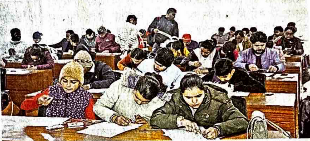
एमडीयू में हैप्पीनेस कार्यक्रम के तहत पोस्टर बनाते प्रतिभागी।

जागरण संवाददाता, रोहतक : हैप्पीनेस को जीवन के कण-कण में समाहित करने, खुशी की मुहिम को यूनिवर्सिटी मुहिम बनाने, तथा विश्वविद्यालय में खुशनुमा माहौल सृजित करने के उद्देश्य से शुक्रवार को महर्षि दयानंद विश्वविद्यालय के हैप्पीट्यूड लेबोरेट्री के तत्वावधान में डा ए हैप्पी पर्सन गेम का आयोजन किया गया।